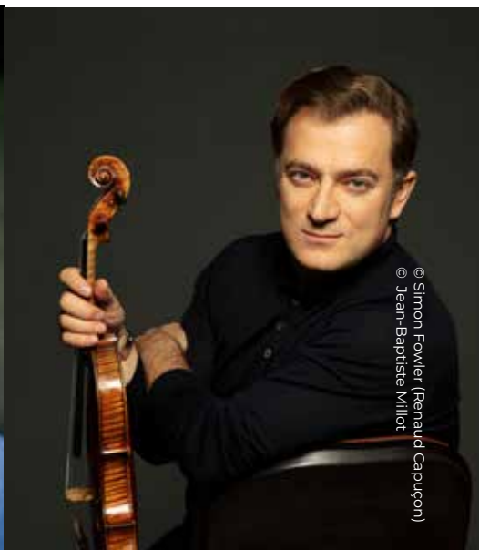
(Renaud Capuçon)