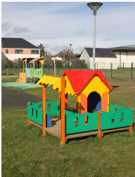
Le multi-accueil à Gien

Centre Nelson Mandela 31, Avenue Louis Maurice Chateaux 45200 Montargis - 02 38 77 02 33 contact45@cidffcentrevaldeloire.fr